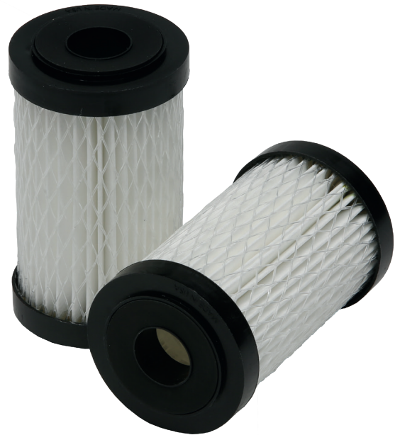
4evergreen VirusSampler NC2,5-5

- Vi är glada att vår produkt 4evergreen VirusSampler bidrar till insamling av data, vilket ger ett värdefullt tillskott för att öka kunskapen kring covid-19.