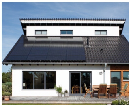
Komplettera din värmepumpsanläggning med Viessmanns solceller