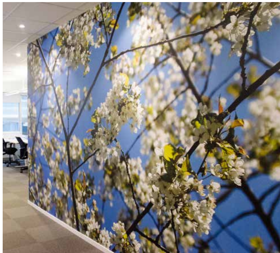
Över hundra fotografier kom in i en tävling för Siemens personal. Målet var att få fram bilder för till ett 40-tal fotofondväggar.