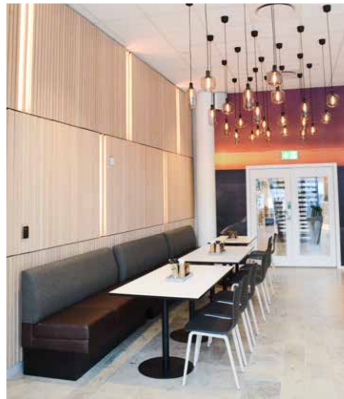
Armaturer och belysning är viktiga i detaljer i inredningen. Armatur Royal Copenhagen, Soffa Vilax, bord EFG och stol Arper.

– Tillsammans med Siemens har vi valt möbler för många olika behov och →