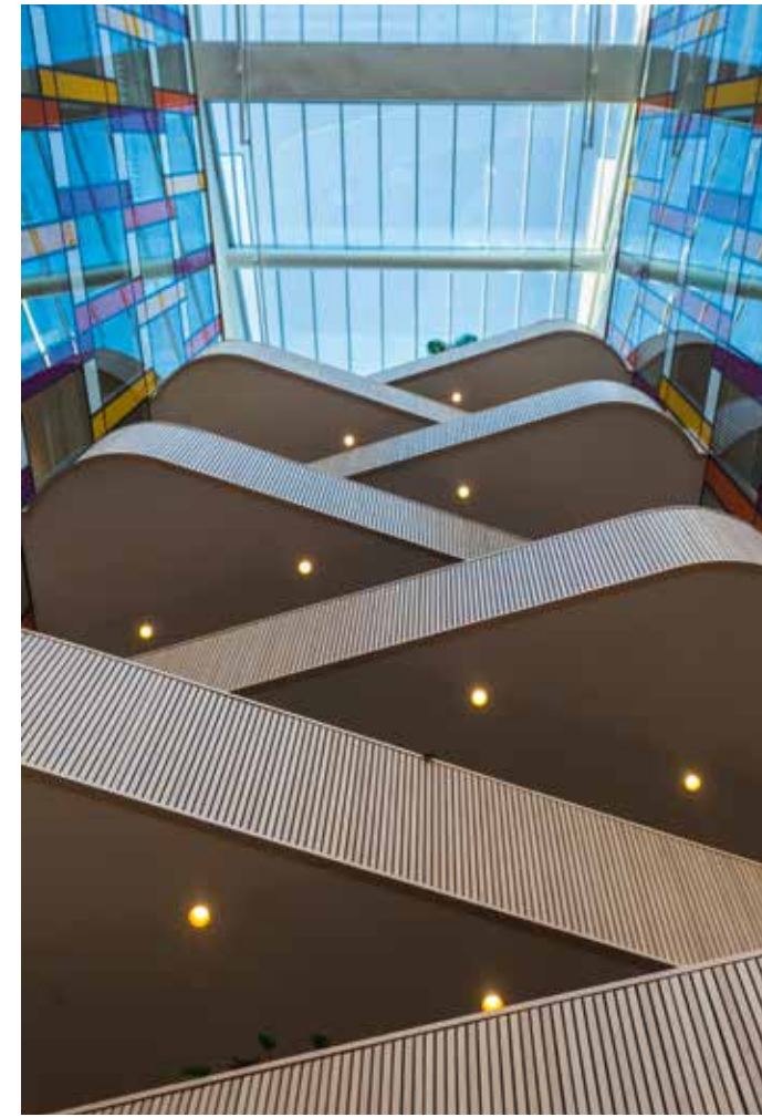
Kontrasten är stor mellan våningsplanens ljusa och lugna träpaneler i lönn och de starkt färgade strimmorna på glasväggen.