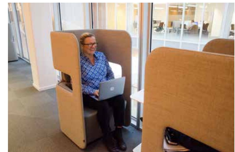
Stolen Podseat ger en avskärmning som ibland kan vara skön.