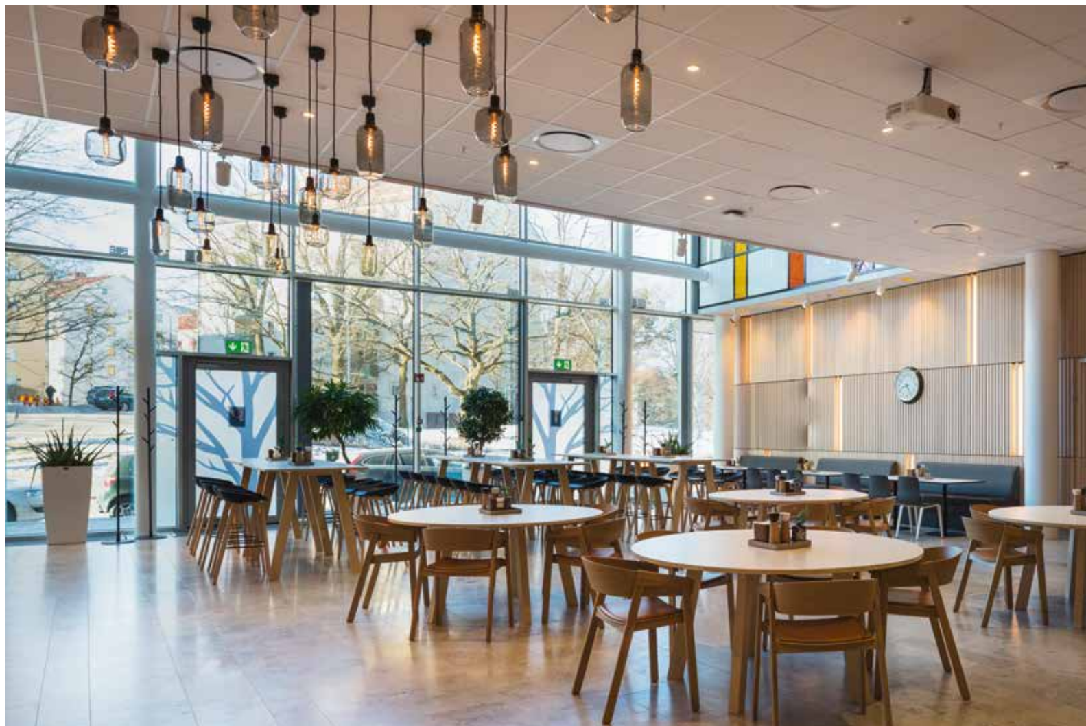
Matsalen ska vara en plats för trevligt umgänge och spontana möten. Armaturer Royal Copenhagen, stolar Muuto och bord EFG.

→ situationer. Möblerna ska också hålla över tid. Därför har vi i stor utsträckning valt tidlösa klassiker, säger han.