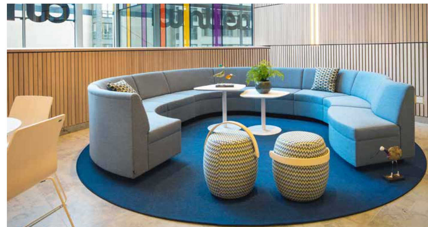
Soffan från EFG och puffarna från Offecct inbjuder till en stunds samvaro.

Konferensrummen har namn med anknytning till Siemens verksamhet. På de höga glasytorna utanför varje rum sitter intressanta faktatexter på svenska och engelska om företaget. ♦