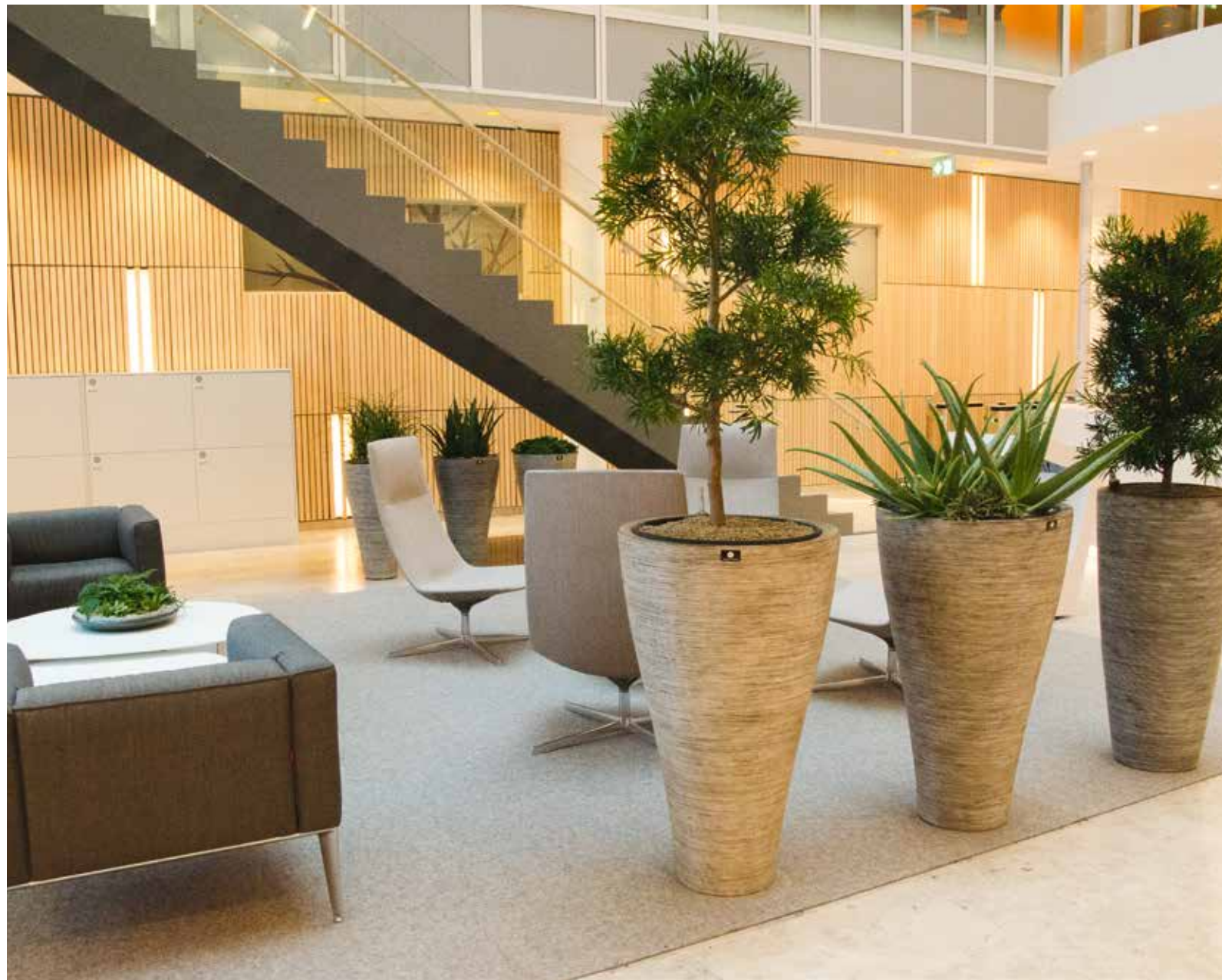
Hässelby blommor har bidragit med den gröna atmosfären i receptionen. Soffbord Erik Jörgensen och fåtöjlerna till vänster Arper.