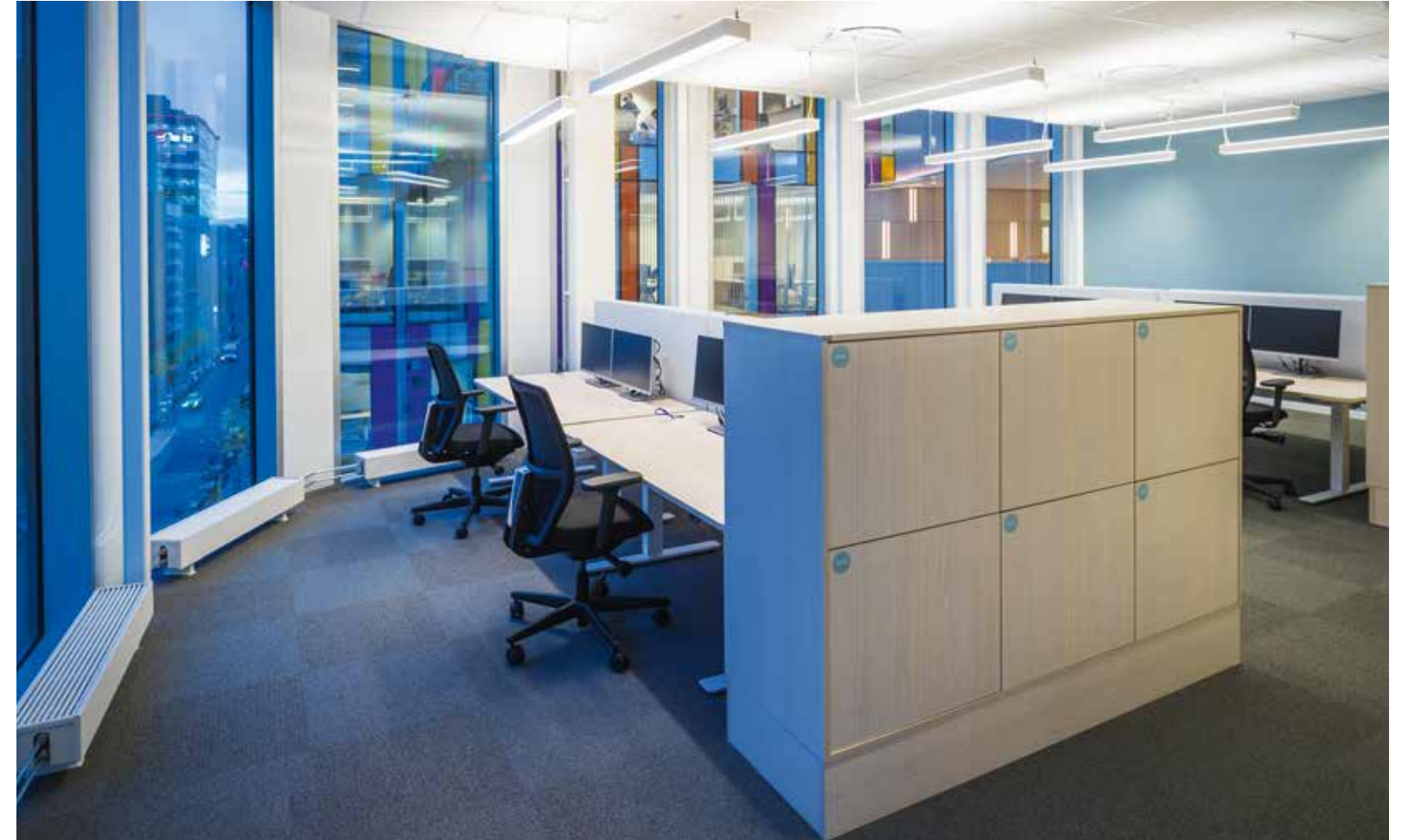
De anställda kan själva reglera ljuset på arbetsytorna genom en app i mobilen. Bord och förvaring från EFG.