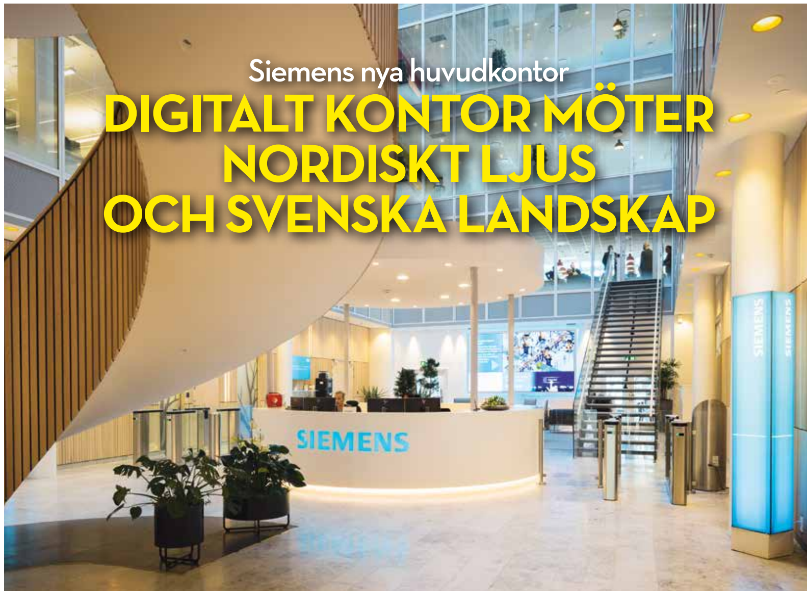
Bakom receptionsdisken syns en stor skärm där Siemens olika projekt och tekniska lösningar visas.

Siemens nya huvudkontor i Arenastaden utstrålar tidlöshet och nordiskt ljus.