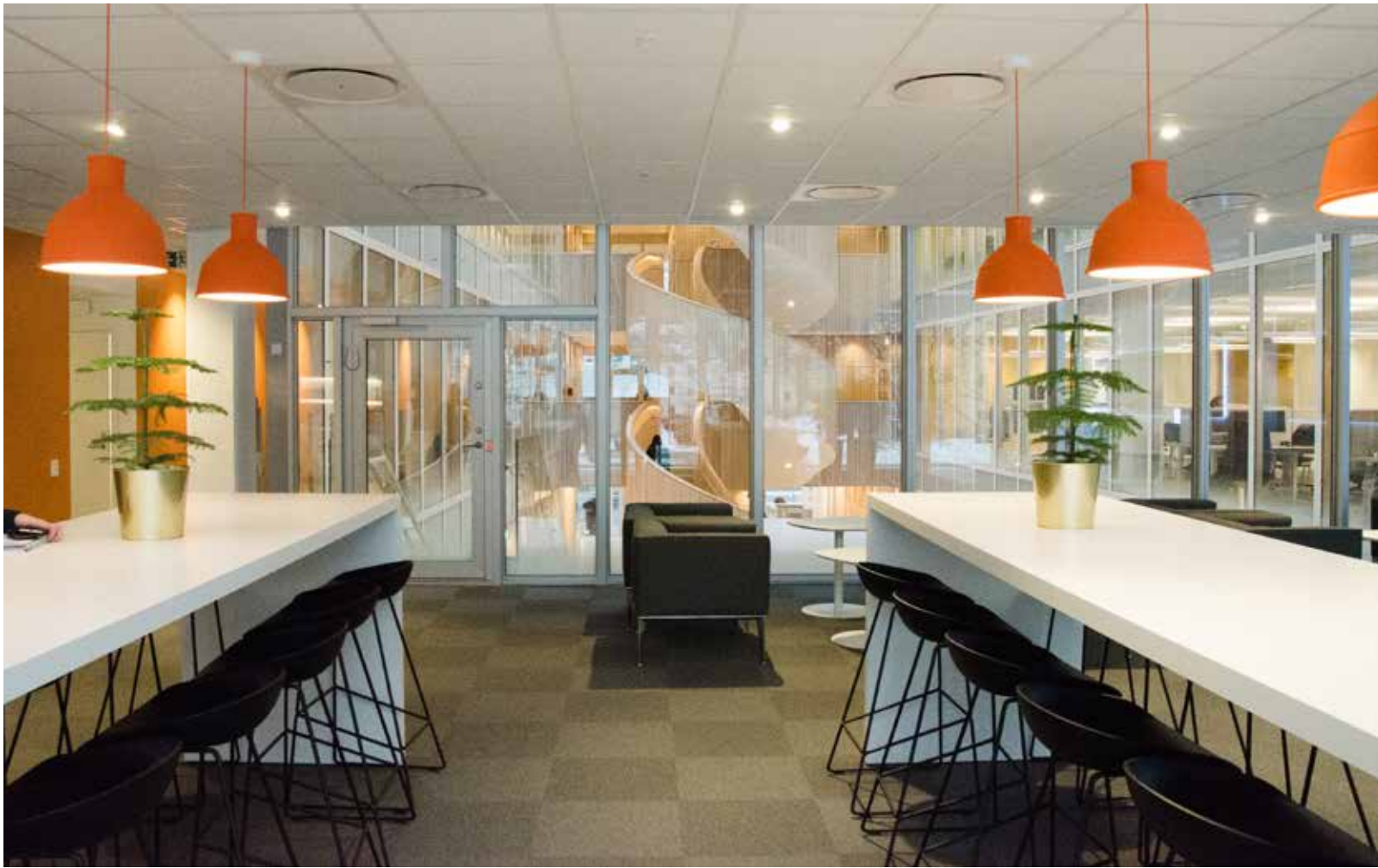
I showroom hålls presentationer och genomgångar. Bord Magnus Olesen och lampa Muuto.