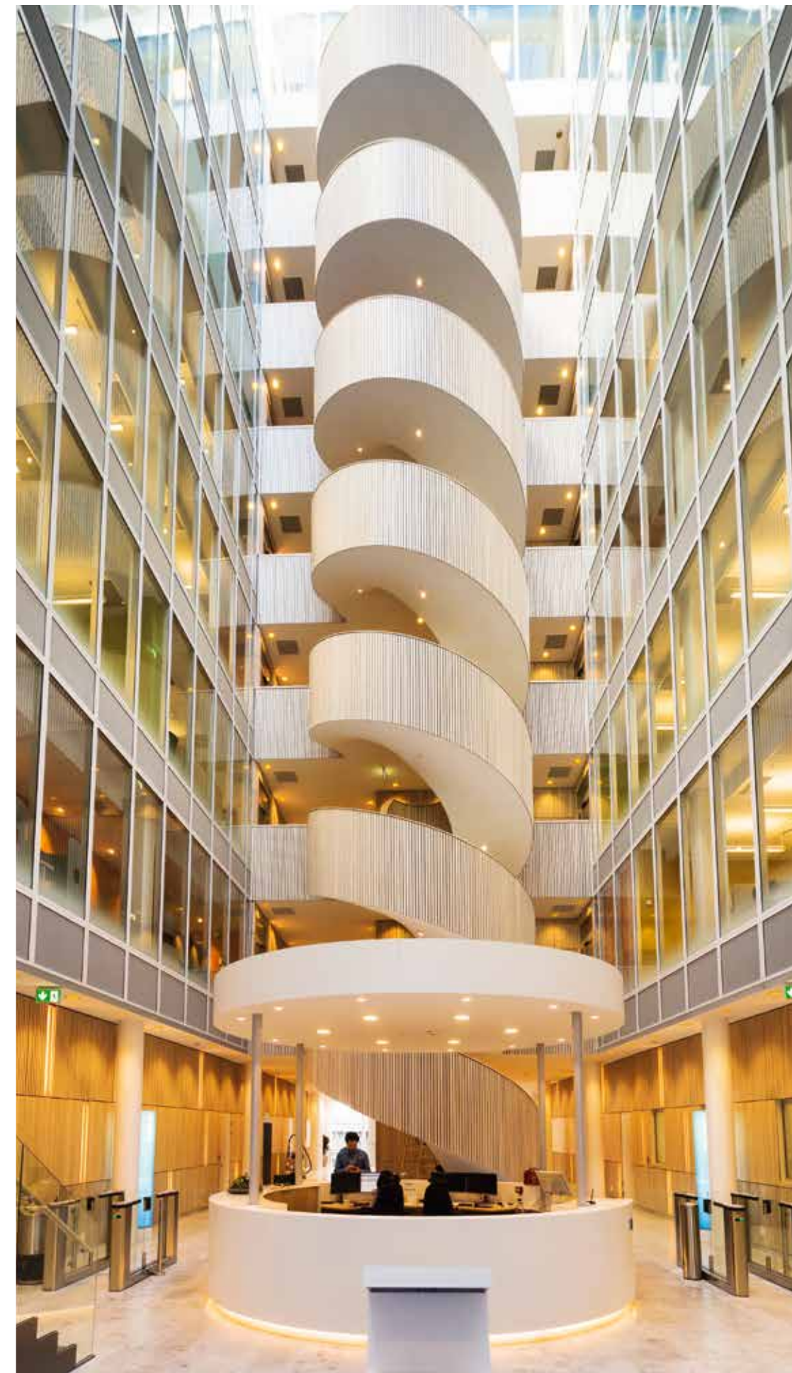
Som en jättelik serpentin ringlar trappan sig upp.

Tina berättar att Siemens ville bygga ett kontor där människor möts. Det är ett modernt flexkontor, eller aktivitetsbaserat kontor med ett annat ord. →